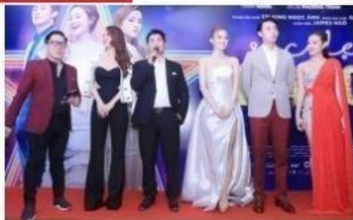
Sắc đẹp ngàn cân tung bùng ra mắt tại Hà Nội