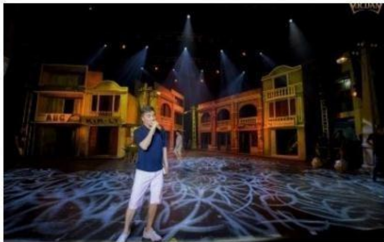
Đàm Vĩnh Hưng tất bật chuẩn bị cho liveshow Bolero tái hiện Sài Gòn xưa