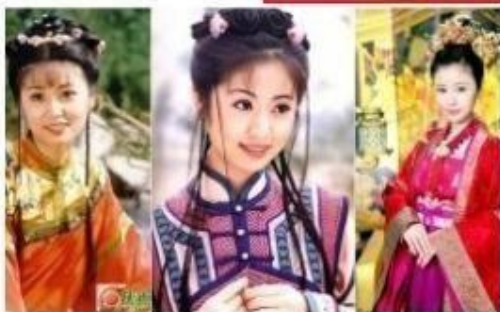
Lâm Tâm Như, nữ diễn viên đa tài, xinh đẹp của màn ảnh Hoa ngữ