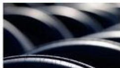
Lốp xe có thể tự