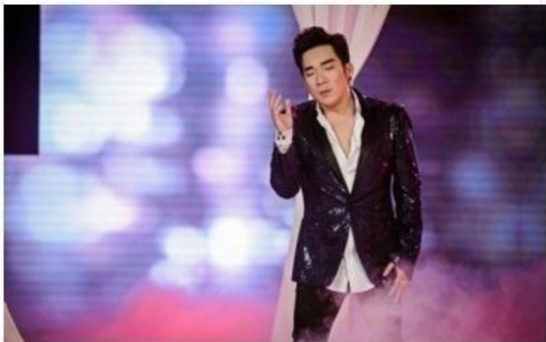
Quang Hà: 'Đủ duyên, đủ nợ thì cưới, chứ tôi không sợ mất fan'